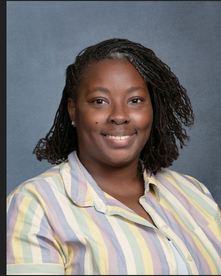
MRS. WHITE SECRETARY