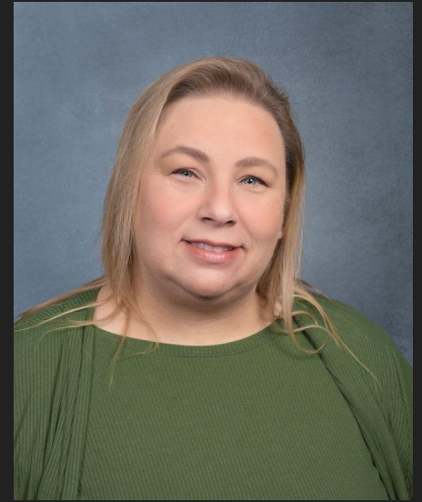
MS. KEYS BOOK KEEPER